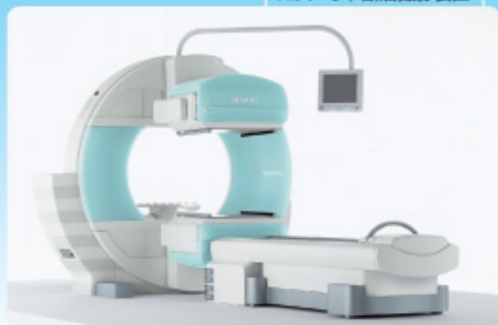
RIスベクトル断層撮影装置