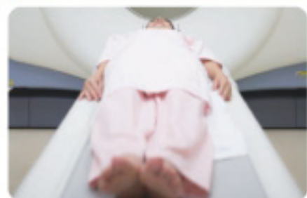
CT放射線断層画像装置