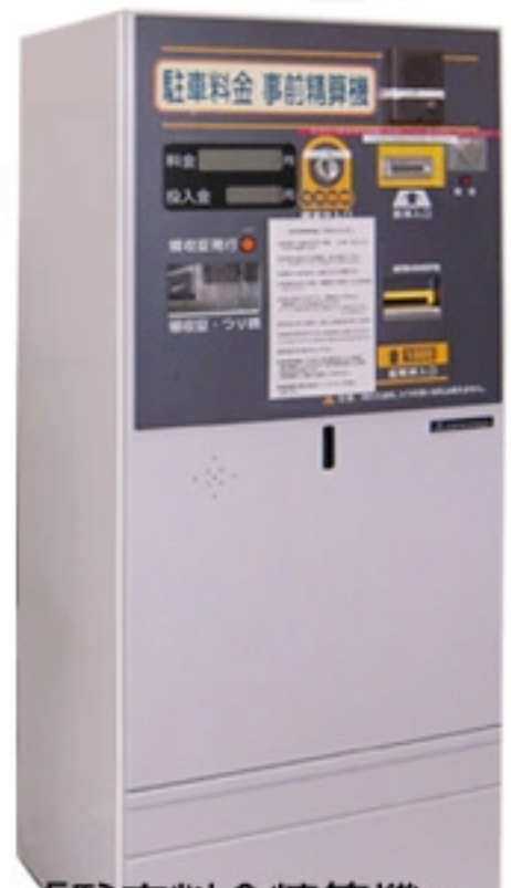
「駐車料金精算機」 1 階エントランスホール